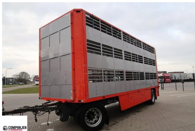
CUPPERS LVA 10 10 - 3 floors - pigs transport