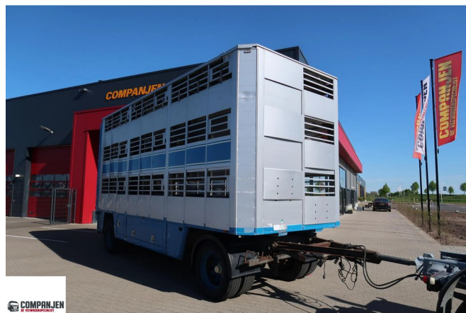
CUPPERS LVA 10-10 AL