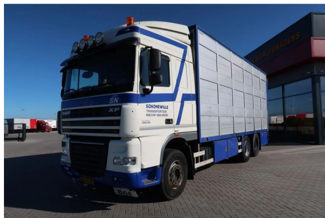
DAF XF 105 105-410