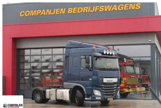
DAF XF 460 H4EN3 - 2016 - Euro 6 - Walking floor + tipper hydraulic 4x2