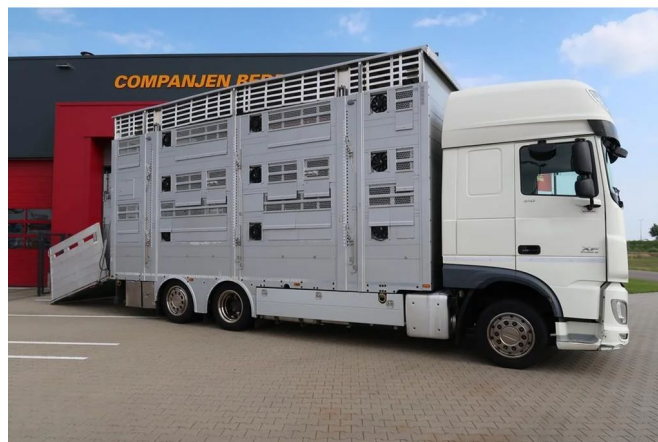
DAF XF 510 Super Space Cab