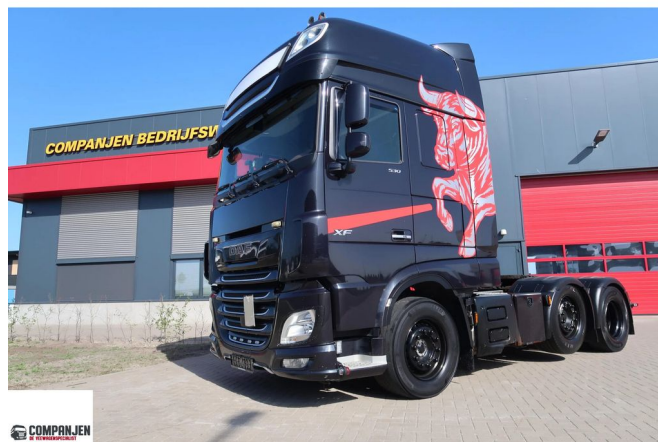
DAF XF 530 XF 530