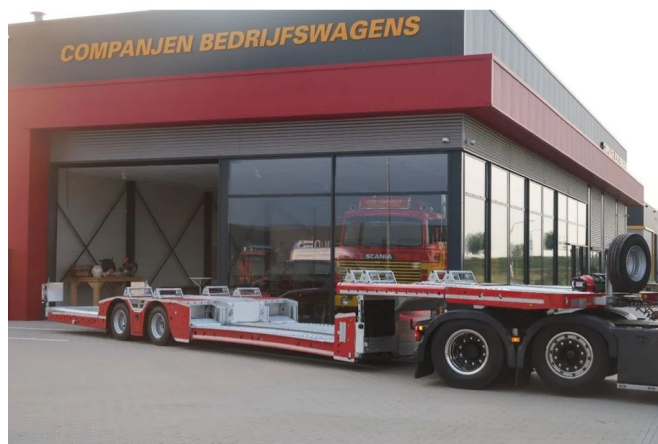
Diversen Eroglu TRR-TC-02