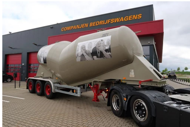
Diversen Filliat XTR32E2