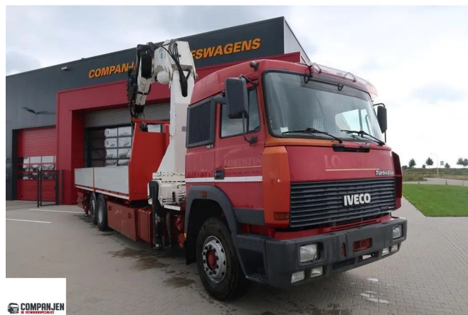
Iveco Turbostar 190.36 190-36 - 1992 - Bonfiglioli - totally complete 6x2