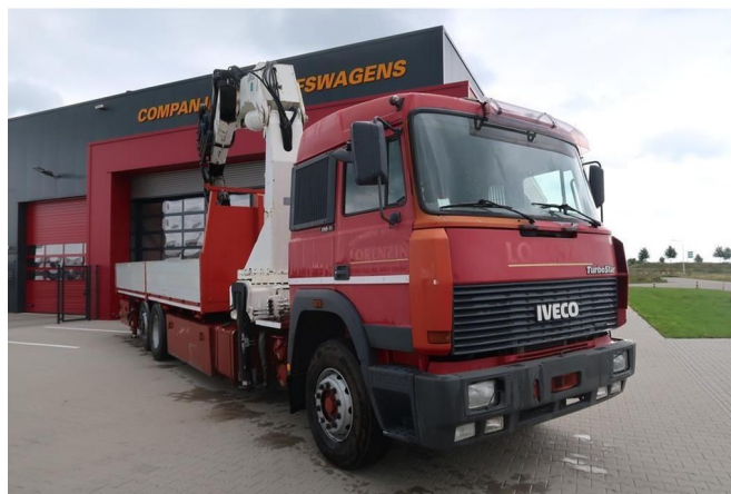
Iveco Turbostar 190.36 190-36