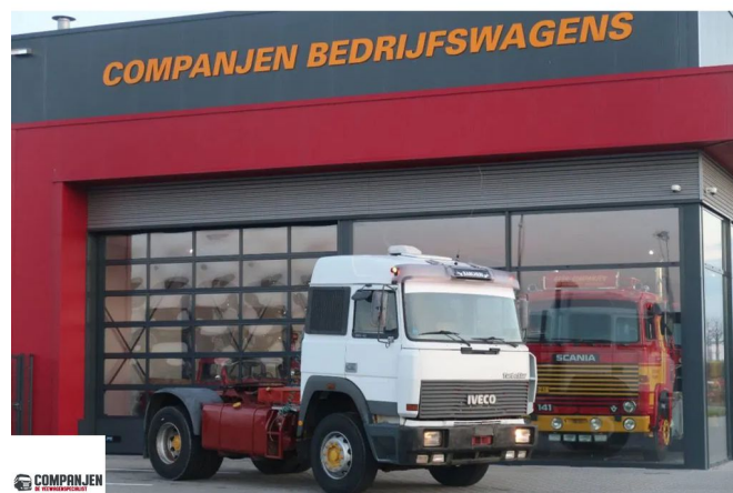
Iveco Turbostar 190.42 V8 190.42 - 1991 - PTO - Oldtimer