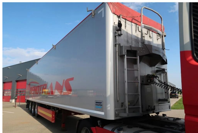
Knapen Trailers K200