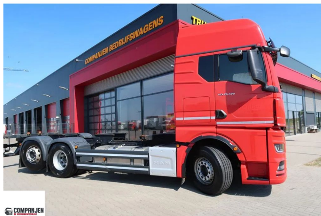
MAN TGX 26.470 - BDF - Retarder - 2021 - Steering axle