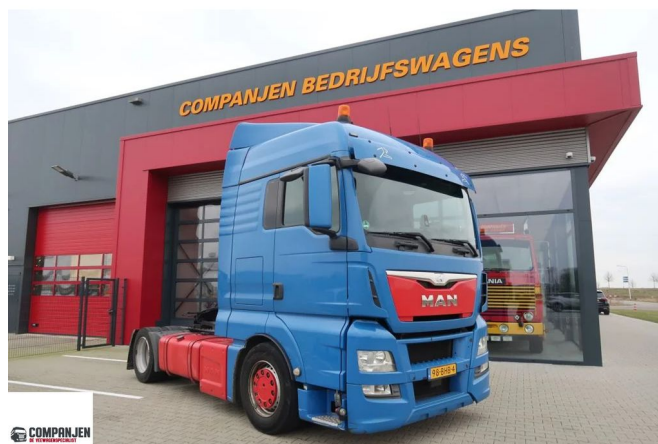
MAN TGX L 2007.46.001 - 2016 - Euro 6