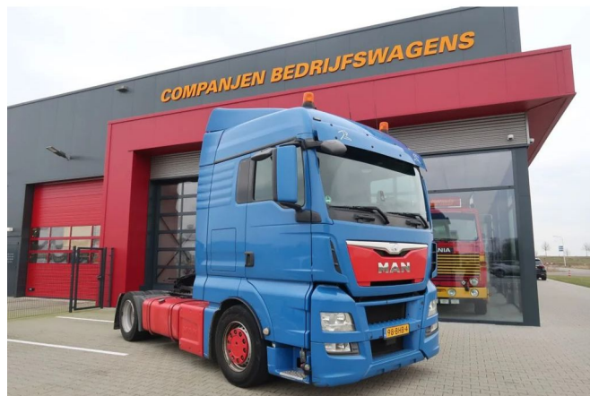
MAN TGX L 2007.46.001