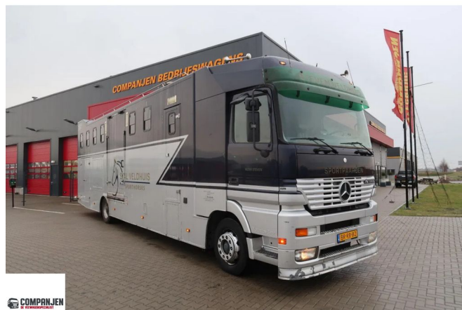
Mercedes-Benz Actros 1835 Horse transport