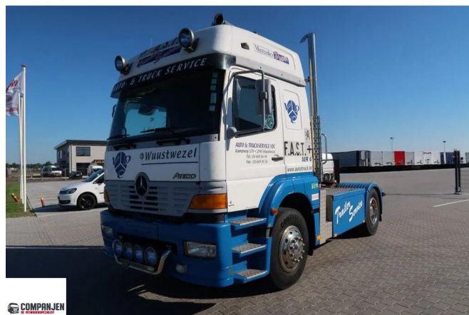
Mercedes-Benz Atego 1828 Atego 1828 LS - 1999