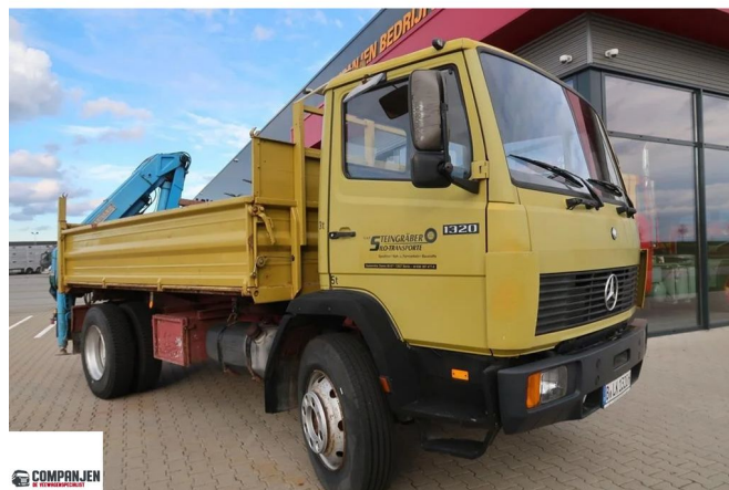
Mercedes-Benz SK 1320 SK1320 - 1988 - Side tipper - Meiller crane -... 4x2