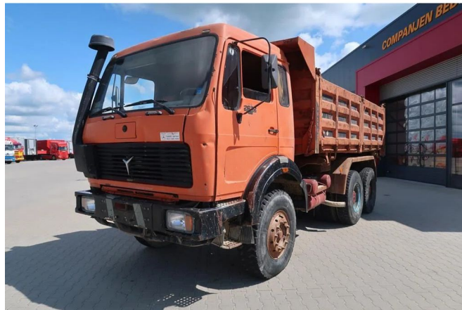
Mercedes-Benz SK 2632