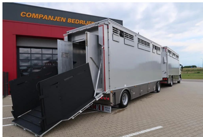
Pezzaioli RBA22 ER