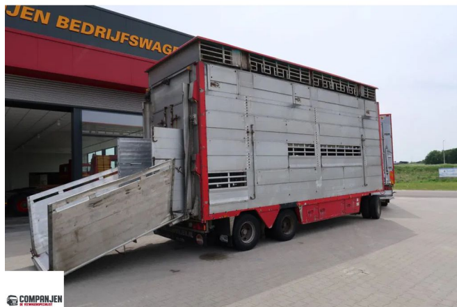
Pezzaioli RBA31 - 2002 - Livestock transport - 2 Floors