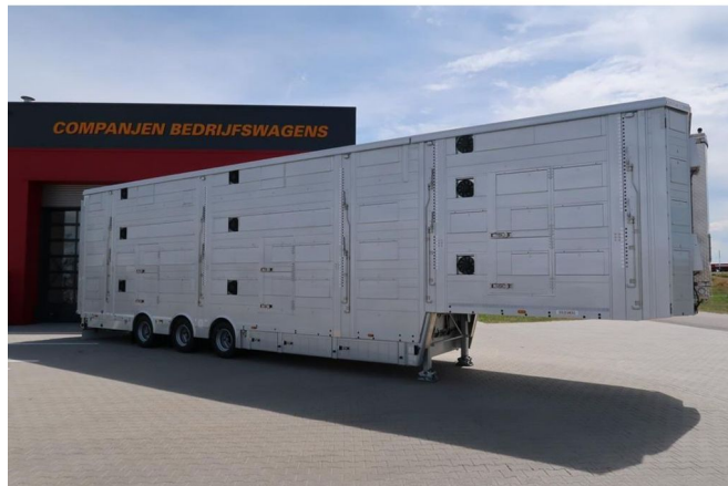
Pezzaioli SBA 31