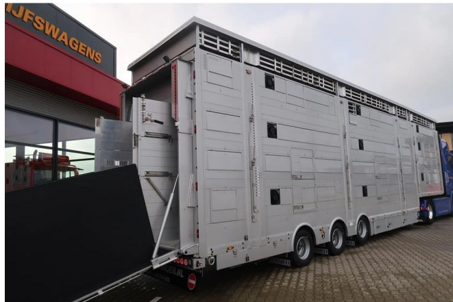
Pezzaioli SBA 31