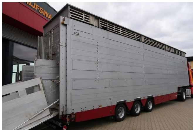
Pezzaioli SBA 31