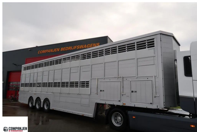
Pezzaioli SBA 63 - NEW Livestock transport