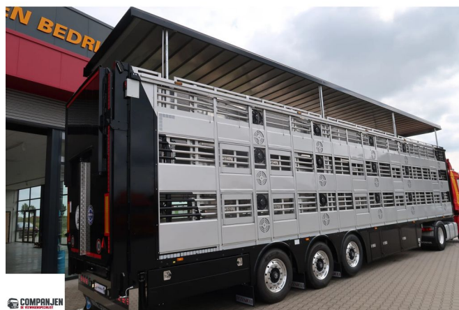
Pezzaioli SBA 63 S - NEW