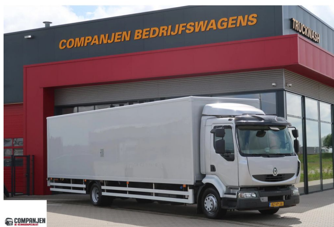
Renault Midlum Hogedruk Reinigingstruck Cleaning truck 5x Yanmar ... 4x2 Referentienummer: BZVP38