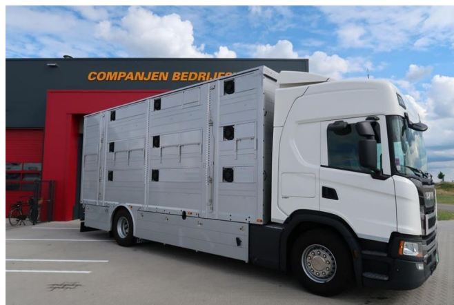
Scania G450 G450