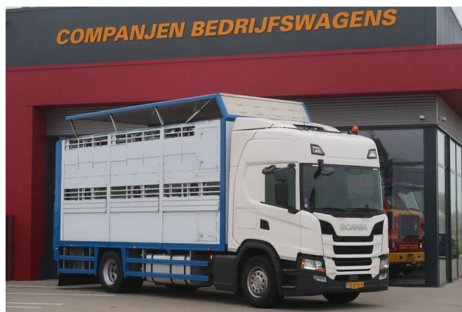
Scania G450 Scania G450 met Cuppers bak