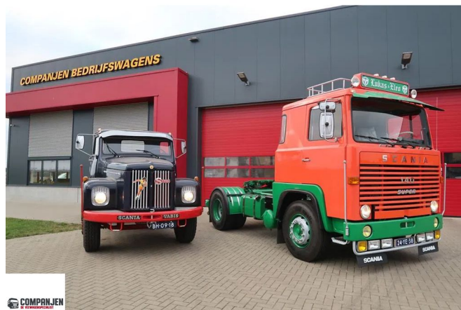
Scania LB140 V8 140