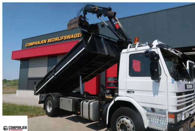
Scania P82 P82M - 1986 - Tipper - Hiab crane - good condition 4x2