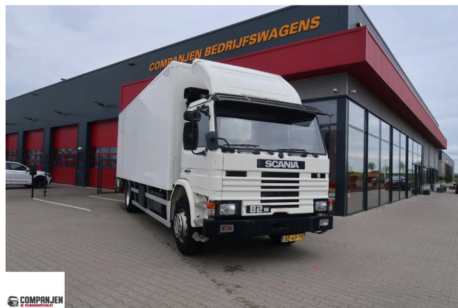
Scania PM 4X2 AL 60 100 P 82 M