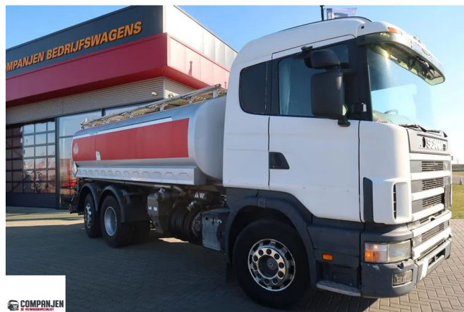
Scania R124-400 Tankauto