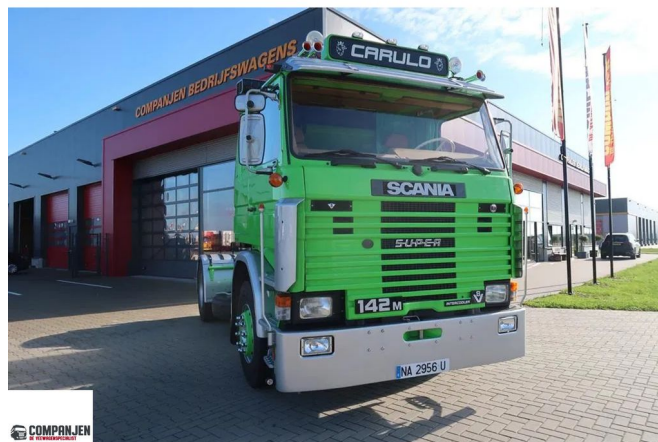
Scania R142-V8 R 142 MA - 1987 - Retarder - Oldtimer - Good Condtion. 4x2