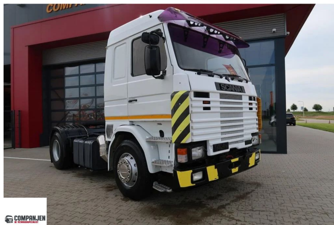
Scania R143-450 V8 143-450 Topline - 1989 - Retarder