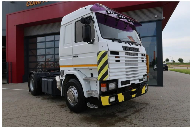
Scania R143-450 V8 143-450 Topline