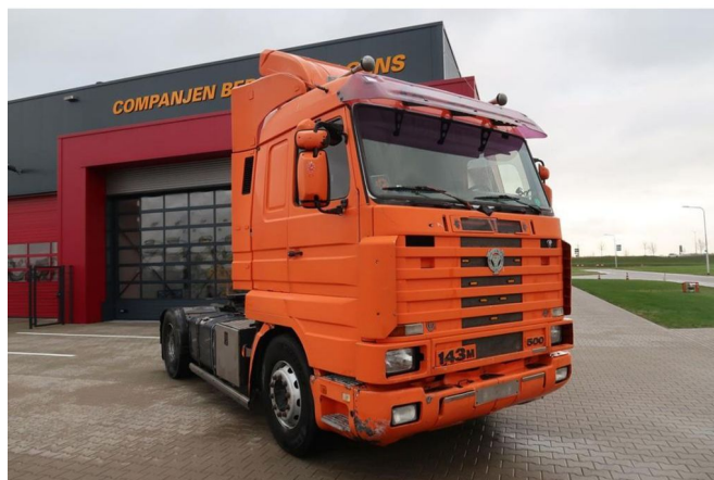
Scania R143-500 V8 143-500 Streamline