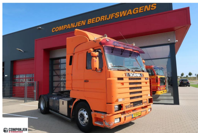
Scania R143-500 V8 met nieuwe APK - with new MOT - Mit neuem TuV 4x2 Referentienummer: 79BVD4