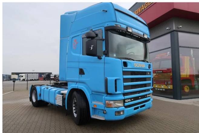
Scania R164-480 164-480