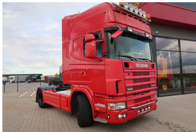
Scania R164-480 V8