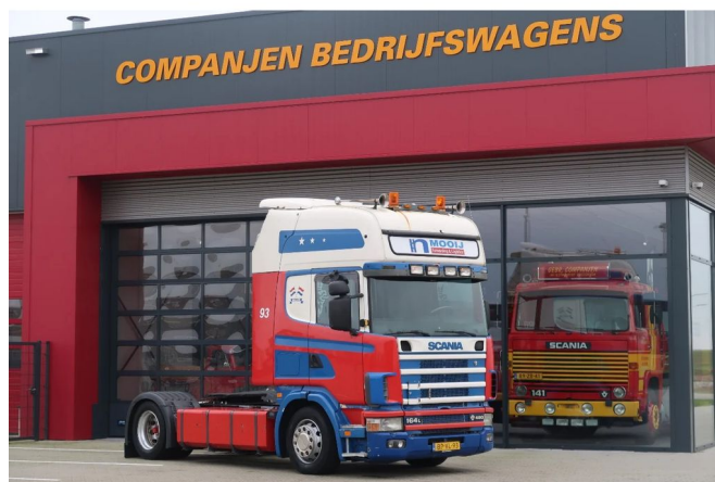
Scania R164-480 V8 Full AIR Marge auto geen btw.