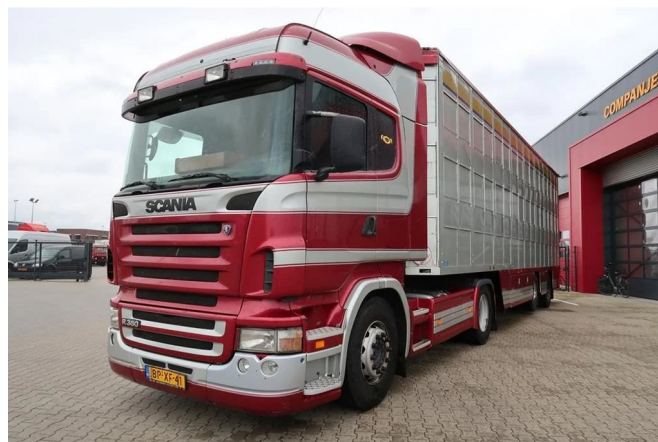
Scania R380 Highline