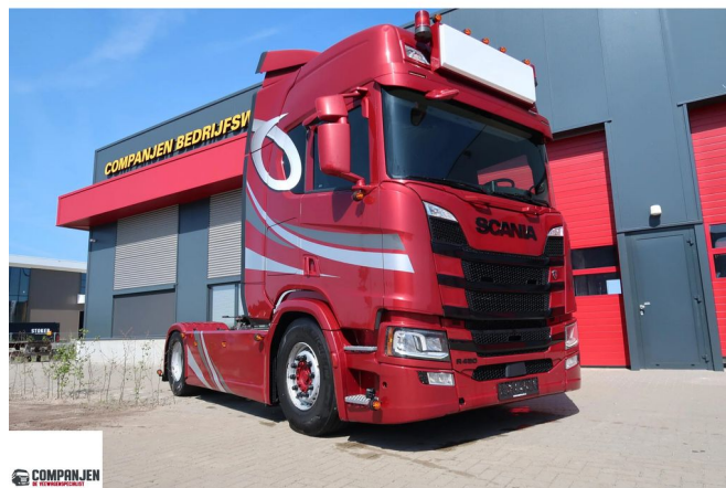
Scania R450 R450