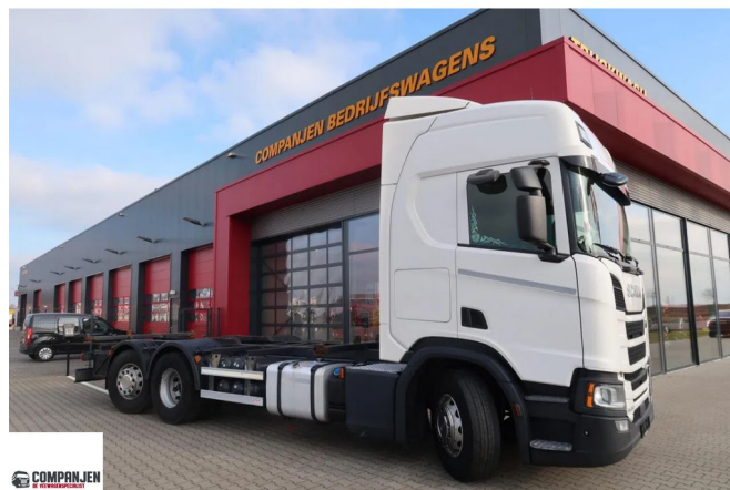
Scania R450 R450- BDF - Steering axle