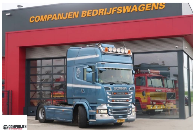
Scania R520 R520