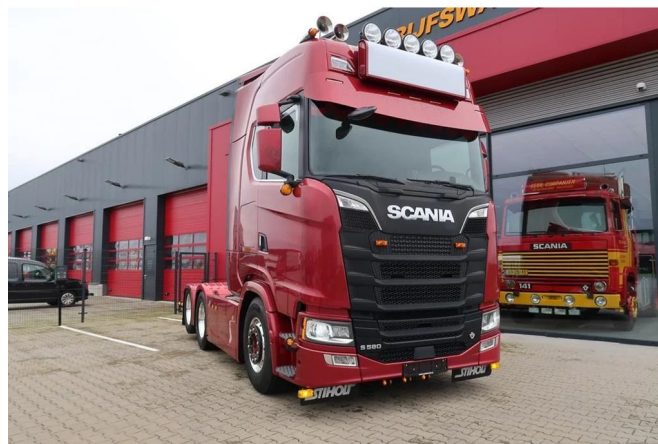
Scania S580 V8