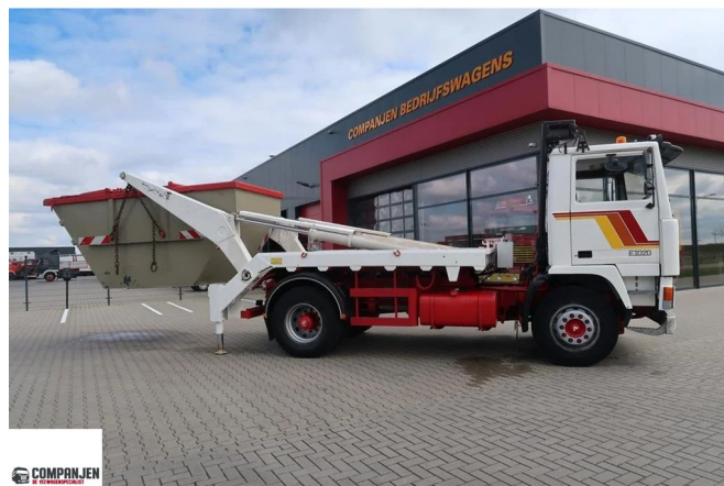
Volvo F 10 F10 4x2 - 1979 - Container Oldtimer