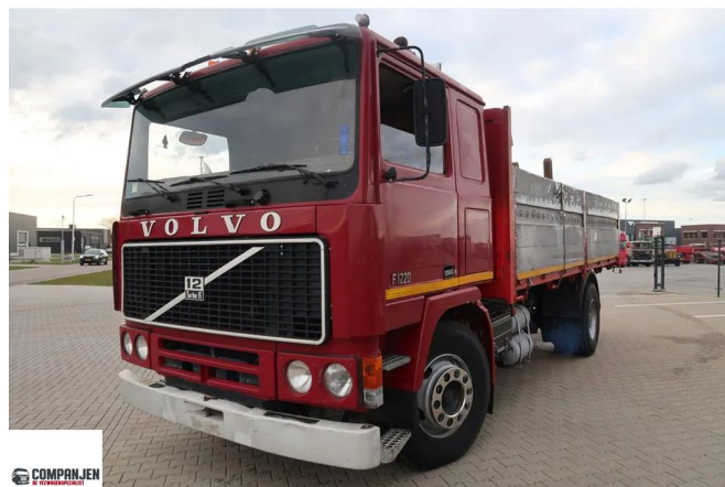
Volvo F 12 F 12-20 - 1976 - Oldtimer