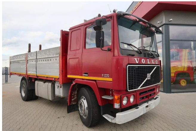
Volvo F 12 F 12-20