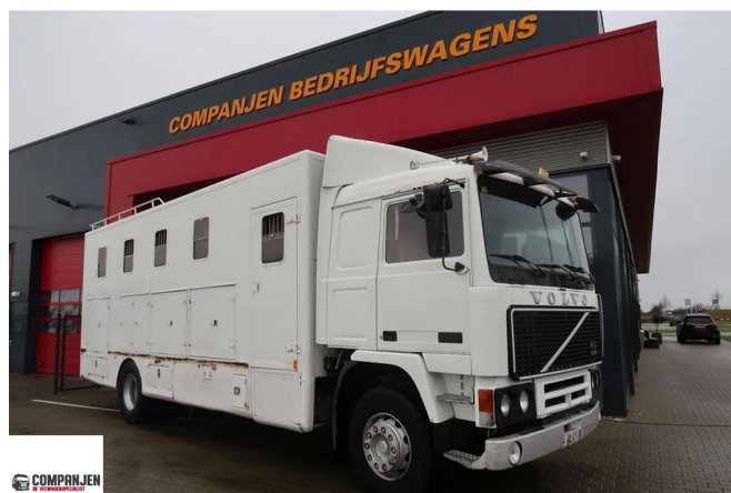
Volvo F 12 F12-20 - 1986 - Horse transport - Oldtimer